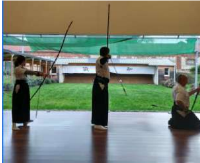
Shajo pour 6 tireurs