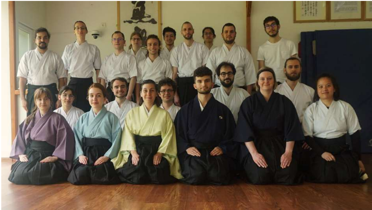
Photo de la 1ere Rencontre Jeune 2023