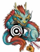
Photo de la Rencontre Jeune 2024