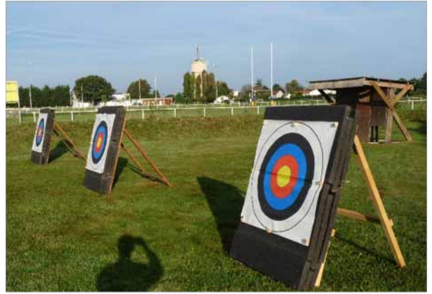
Les 3 cibles à 60m

Depuis Gare St Lazare ou Gare du Nord : RER E, 50 mn (Magenta). Un train toutes les 30 mn. Attention bien vérifier que le train est à destination de Tournan.