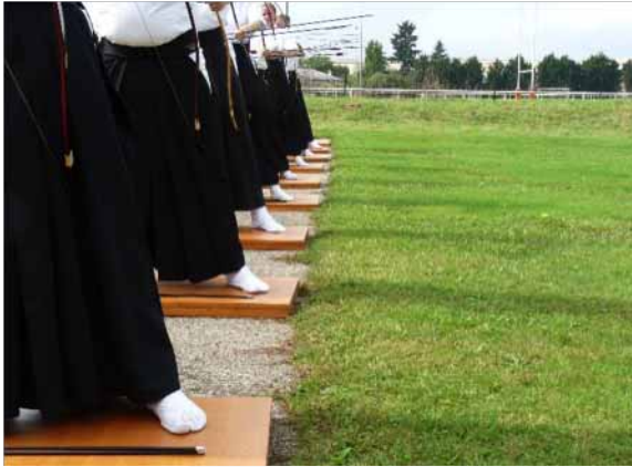
Planchers pour 9 tireurs en ligne

Stade municipal de Tournan-en-Brie - Rpt C. Santarelli Rte de Fontenay - 77220